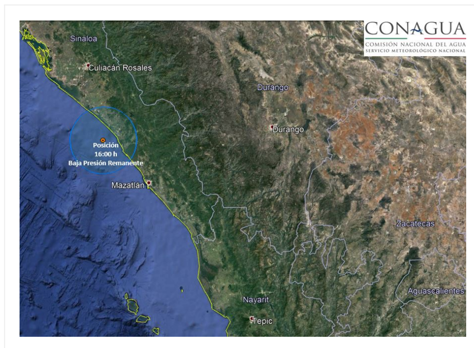
Posición de la baja presión remanente de "Pilar"